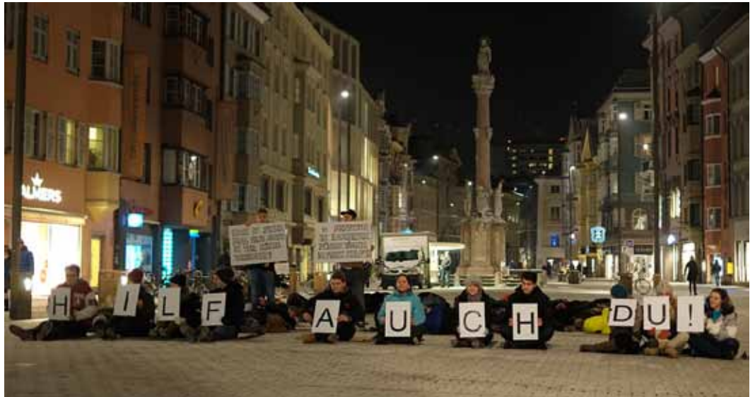
Smartmob zum Thema Obdachlosigkeit: StudentInnen der FH Kufstein organisierten mit der youngCaritas eine Straßenaktion zur Bewusstseinsbildung.